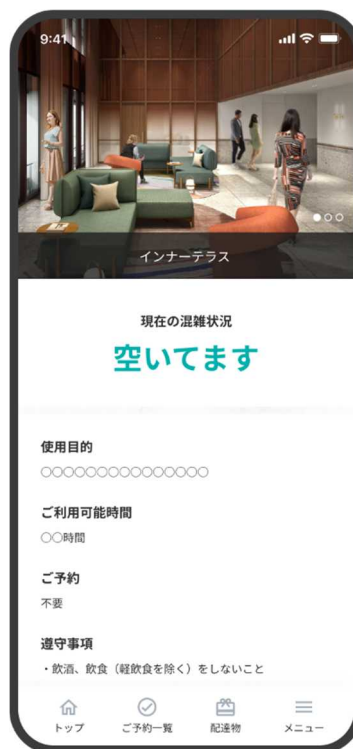
「スミカレジデンスアプリ」イメージ