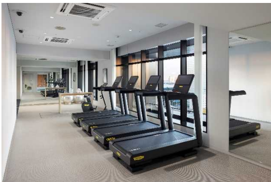
フィットネスルーム