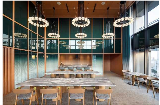
パーティールーム