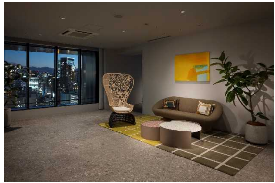
コミュニケーションラウンジ